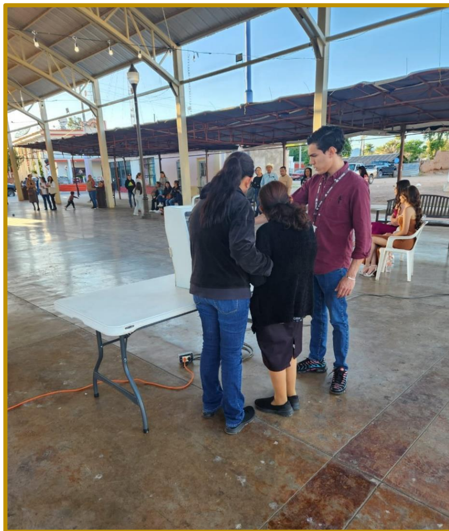
Día 02 de diciembre de 2023. Elección de Reina de las Fiestas Regionales de Sahuaripa 2023.