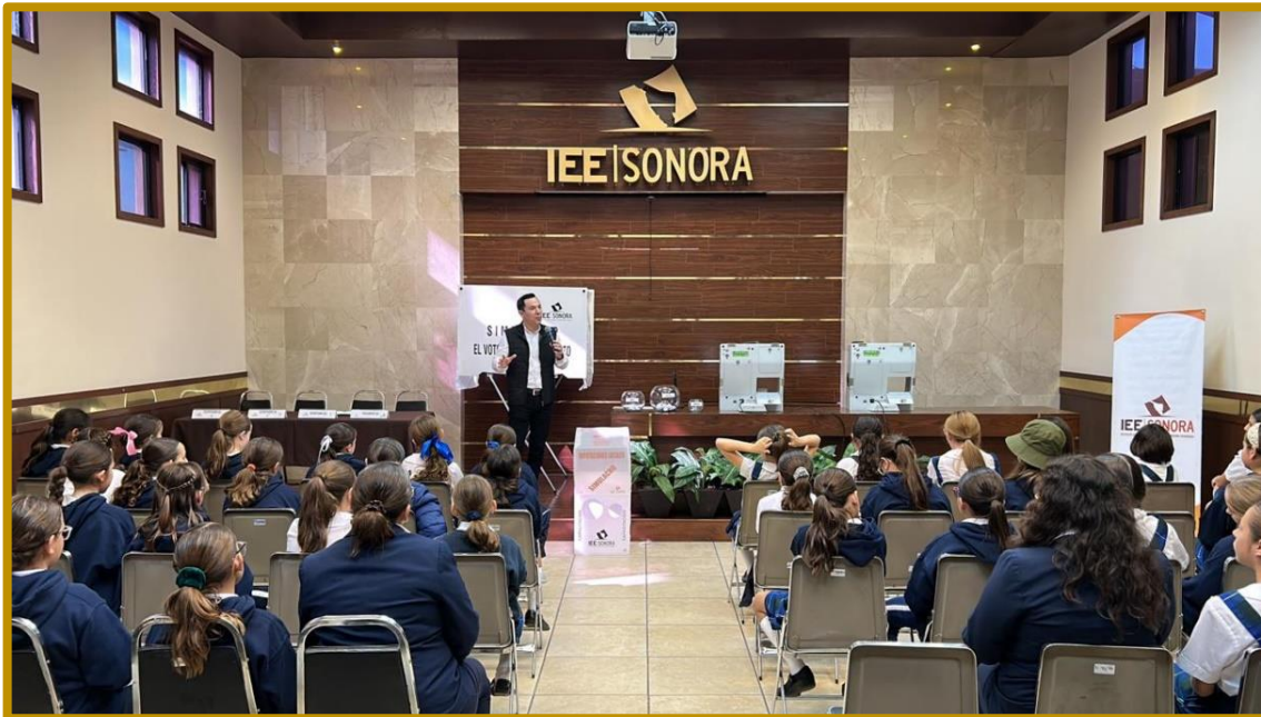
Día 30 de noviembre de 2023. Plática sobre el ejercicio democrático a realizar por parte de las alumnas del Colegio Liceo Thezia, durante la Visita Guiada.