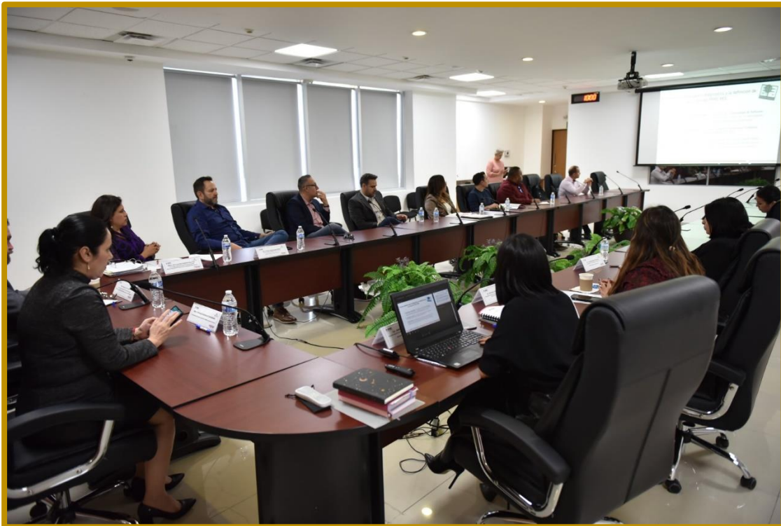
Día 08 de diciembre de 2023. Presentación del Programa de Promoción de la Participación Ciudadana PEC 2023-2024 en la Junta Local Ejecutiva del INE en Sonora.