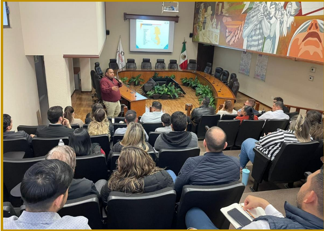
Día 12 de diciembre de 2023. Capacitación al personal del IEE Sonora, sobre Proceso Electoral Ordinario Local 2023-2024.