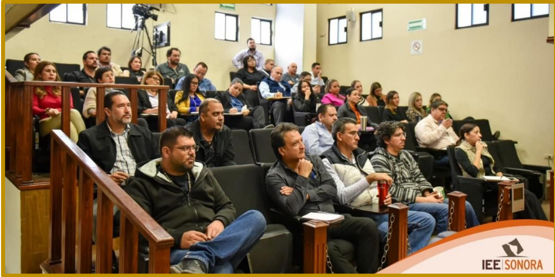
Día 05 de diciembre de 2023. Capacitación al personal del IEE Sonora sobre Proceso Electoral Ordinario Local 2023-2024.