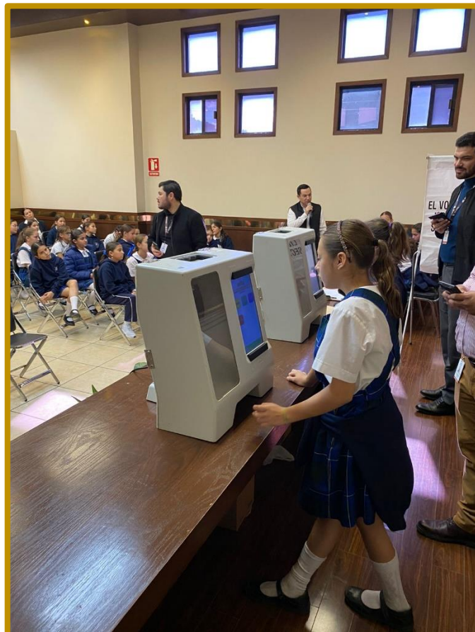
Día 30 de noviembre de 2023. Ejercicio democrático con alumnas del Colegio Liceo Thezia, durante la Visita Guiada.