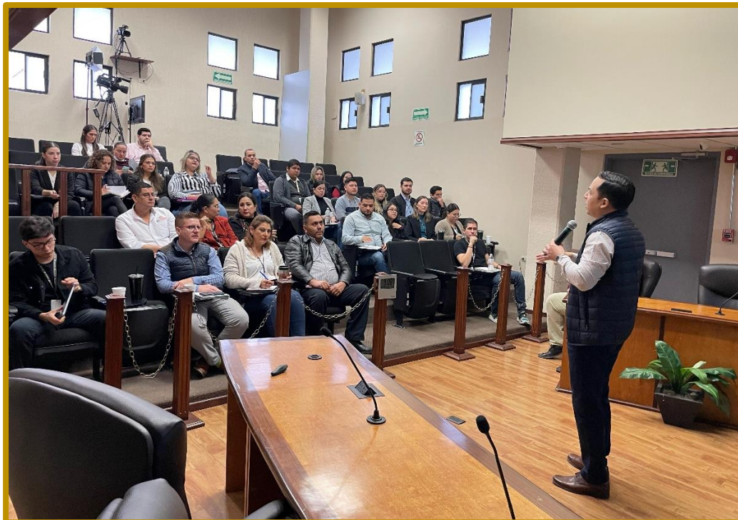
Día 12 de diciembre de 2023. Personal de la DEECyC durante la capacitación al personal del IEE Sonora, sobre Proceso Electoral Ordinario Local 2023-2024.