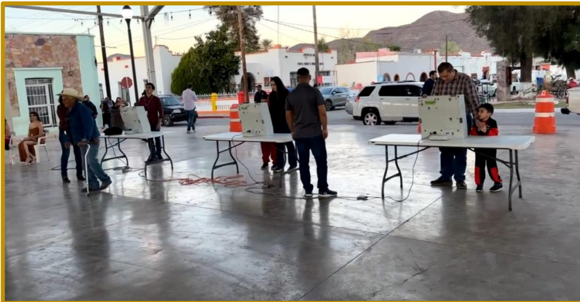
Día 02 de diciembre de 2023. Con el uso de las urnas electrónicas se realizó la votación de Reina de las Fiestas Regionales Sahuaripa 2023.