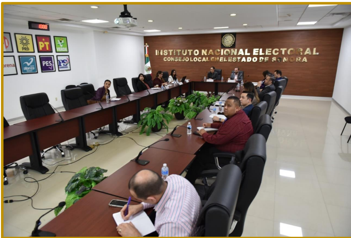
Día 08 de diciembre de 2023. Reunión de trabajo en la Junta Local Ejecutiva del INE en Sonora, sobre el Programa de Promoción de la Participación Ciudadana PEC 2023-2024.