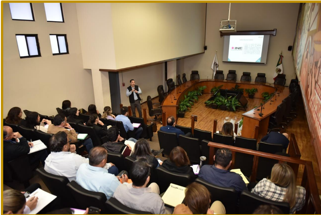
Día 07 de diciembre de 2023. Personal de la DEECyC durante la capacitación al personal del IEE Sonora, sobre Proceso Electoral Ordinario Local 2023-2024.