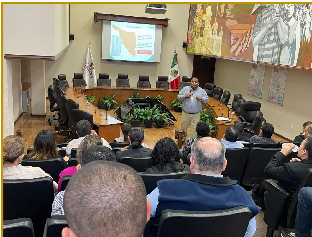
Día 05 de diciembre de 2023. Capacitación al personal del IEE Sonora sobre Proceso Electoral Ordinario Local 2023-2024.

En cumplimiento a la Meta 31 del Programa Operativo Anual 2023 correspondiente a la Dirección Ejecutiva de Educación Cívica y Capacitación, de impartir cursos de capacitación sobre habilidades y competencias a desarrollar para atender las diversas etapas del Proceso Electoral 2023-2024 ; los días 05, 07 y 12 de diciembre de 2023, personal de la Dirección impartió dichos cursos a las personas que integran las distintas áreas del Instituto.