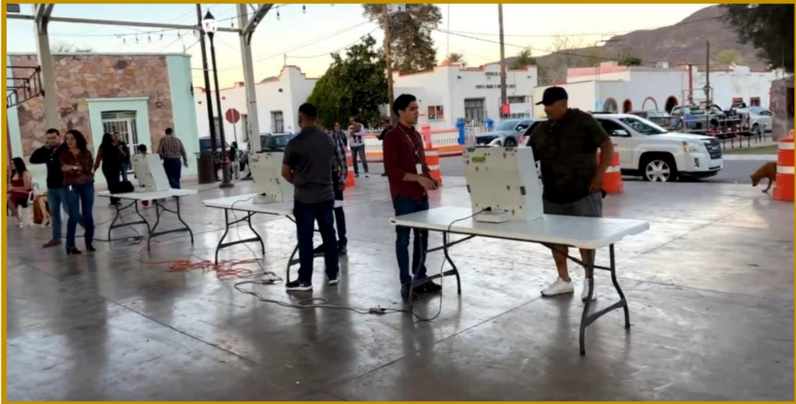
Día 02 de diciembre de 2023. Habitantes del municipio de Sahuaripa durante la votación de Reina de las Fiestas Regionales 2023.