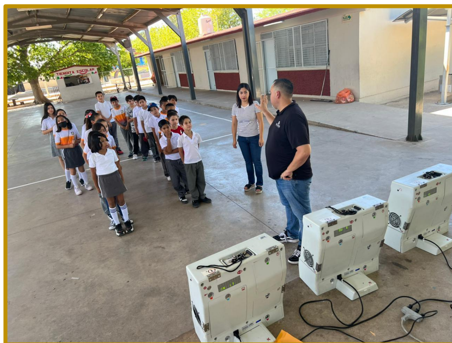
Día 13 de septiembre de 2023. Personal de la DEECyC, explicando el uso de urnas electrónicas a las y los alumnos de la Escuela Primaria Bernardo Rivera R. No. 2