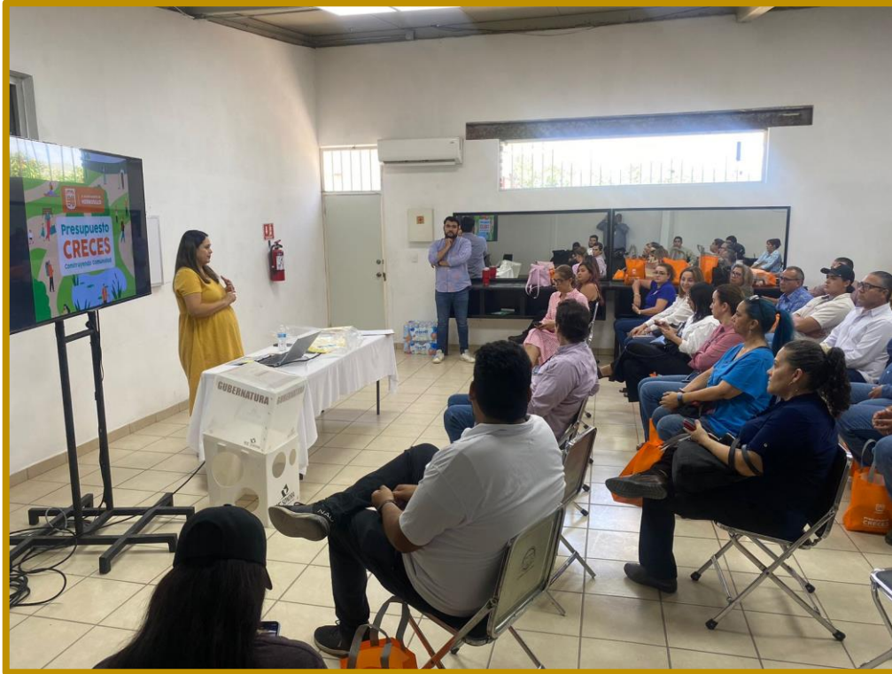
Día 18 de agosto de 2023. Capacitación a personas funcionarias de las mesas de participación ciudadana.