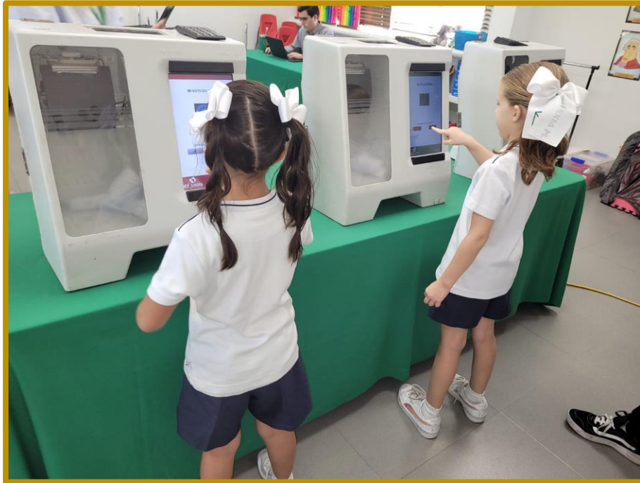
Día 14 de septiembre de 2023. Alumnado del Colegio Irish International School participando en el ejercicio democrático.