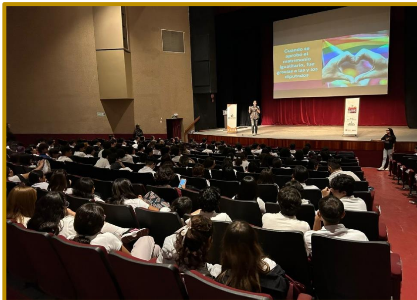
Día 21 de septiembre de 2023. Personal de la Dirección Ejecutiva durante la exposición del programa Mi Primer Voto en el COBACH Villa de Seris.

El jueves 21 de septiembre de 2023, se implementó el programa Mi Primer Voto con el alumnado del COBACH, plantel Villa de Seris . El evento se realizó en el Teatro del COBACH, en el marco de las actividades del 48 aniversario de la institución educativa.