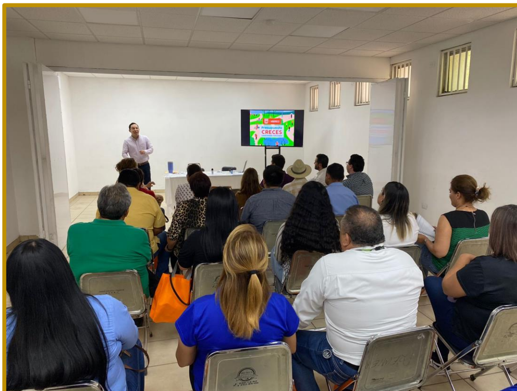
Día 17 de agosto de 2023. Personal de la Dirección Ejecutiva durante la capacitación a las personas que participaron en el ejercicio denominado Presupuesto CRECES.

Los días 17, 18 y 21 de agosto de 2023, personal de la Dirección Ejecutiva acudió a las instalaciones de la Centro Hábitat Solidaridad I, con el fin de impartir capacitación a las personas que participaron como funcionarias y funcionarios de las mesas de participación ciudadana, dentro del programa Presupuesto CRECES del H. Ayuntamiento de Hermosillo.