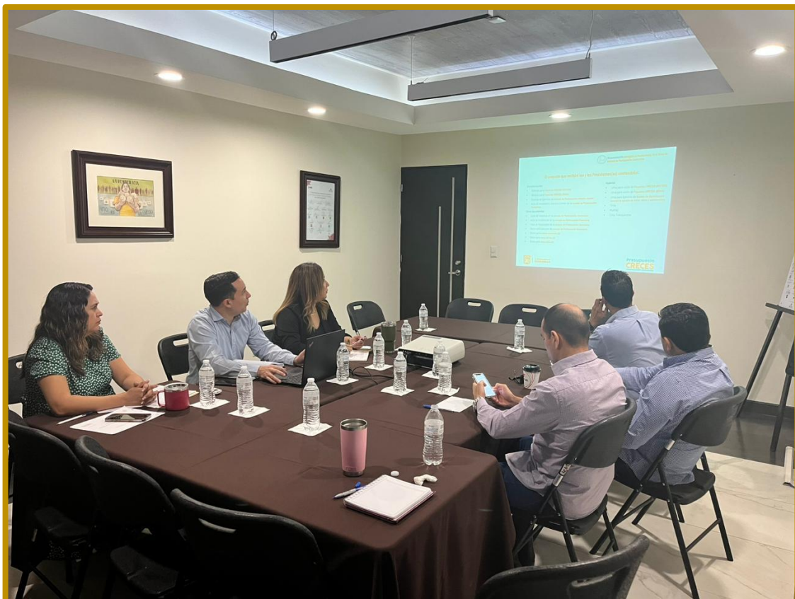
Día 09 de agosto de 2023. Reunión de trabajo con funcionarios del H. Ayuntamiento de Hermosillo y personal de la Dirección Ejecutiva.

El miércoles 09 de agosto de 2023, personal de la Dirección Ejecutiva participó en la reunión de trabajo con personal del H. Ayuntamiento de Hermosillo (Presupuesto CRECES), con el objetivo de brindar asesoría sobre la implementación de la Jornada de Participación Ciudadana, para que mediante el voto libre, directo y secreto, la ciudadanía elija las propuestas de obras y/o servicios para sus colonias y comunidades, que participarán en la asignación de recursos públicos a ejecutarse en el presupuesto municipal de egresos para el ejercicio fiscal 2024.