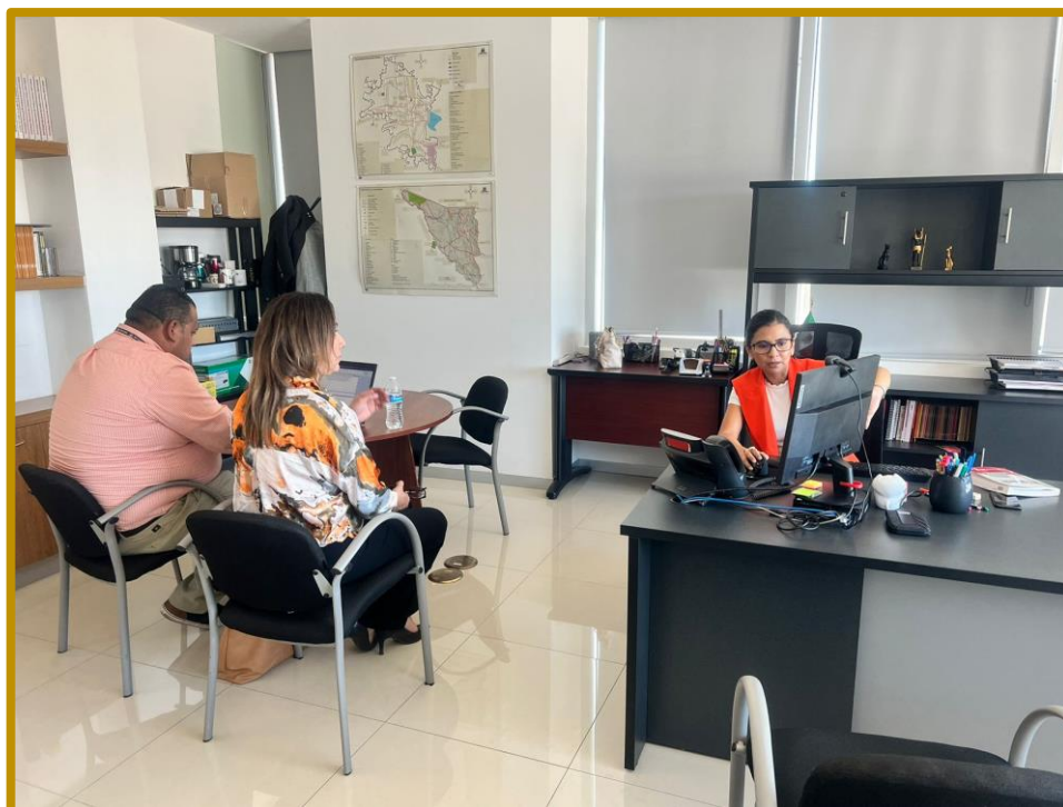
Día 25 de septiembre de 2023. Personal de la Dirección Ejecutiva en reunión de trabajo con la Vocal de Capacitación Electoral y Educación Cívica de la JLE del INE en Sonora