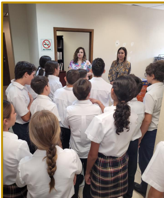
Día 18 de septiembre de 2023. Recorrido por las diferentes áreas del IEE Sonora