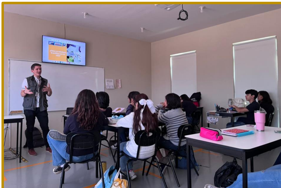
Día 14 de septiembre de 2023. Alumnas y alumnos del Colegio Alerce, atentos a la presentación del programa Mi Primer Voto

El jueves 14 de septiembre de 2023, se realizó la actividad Mi Primer Voto con el alumnado de la preparatoria del Colegio Alerce .