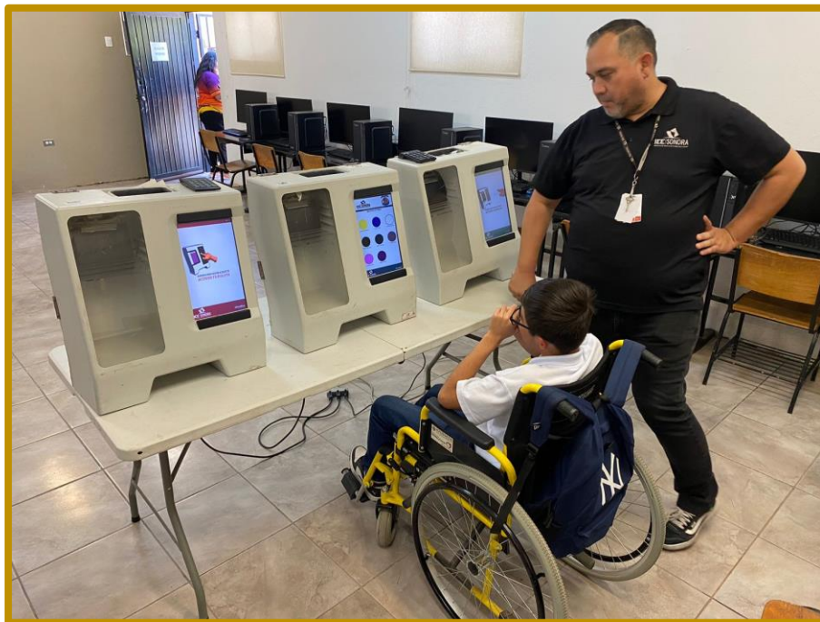
Día 20 de septiembre de 2023. El IEE Sonora garantizando la inclusión de personas con discapacidad en sus programas de educación cívica, evento realizado en la Escuela Secundaria General No.13, “Profr. Heriberto Huerta Luna”