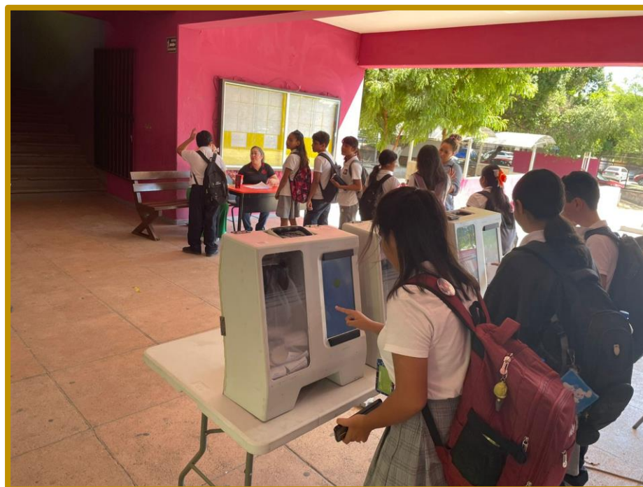
Día 22 de septiembre de 2023. Estudiantes de la Escuela Secundaria Técnica No. 1 Profr. Carlos Espinoza Muñoz, ejerciendo su derecho a votar con urnas electrónicas