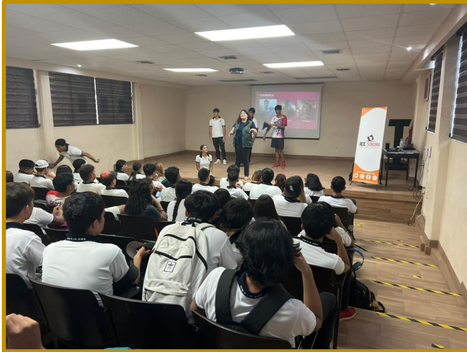
Día 26 de septiembre de 2023. Alumnado del CBTIS 206 previo a realizar el ejercicio democrático utilizando urnas electrónicas.