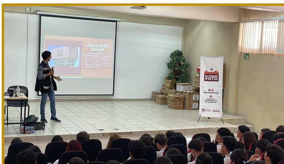
Día 11 de septiembre de 2023. Presentación del programa Mi Primer Voto ante las y los estudiantes del CECyTES, Plantel Alto Valle

Durante los días 11 y 12 de septiembre de 2023, se implementó el programa Mi Primer Voto, con el alumnado de quinto semestre del CECyTE Sonora, Plantel Alto Valle . Las temáticas fueron abordadas de joven a joven y se culminó con un ejercicio democrático utilizando para ello urnas electrónicas.