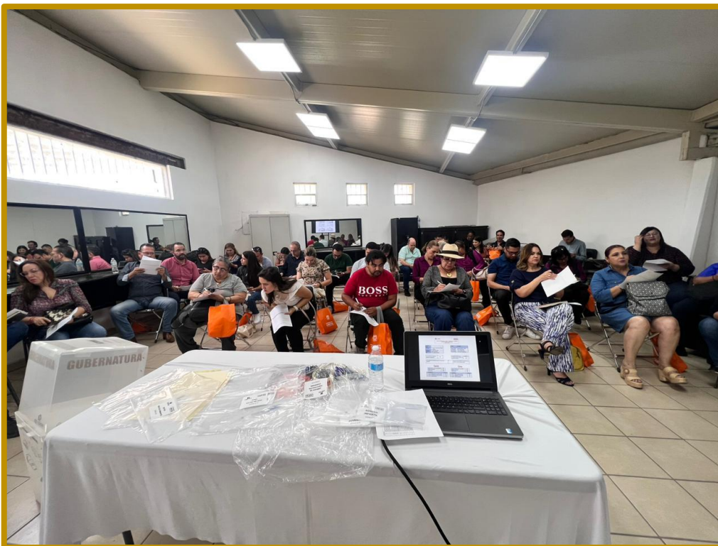
Día 21 de agosto de 2023. Asistentes a la capacitación en las instalaciones del Centro Hábitat Solidaridad I.