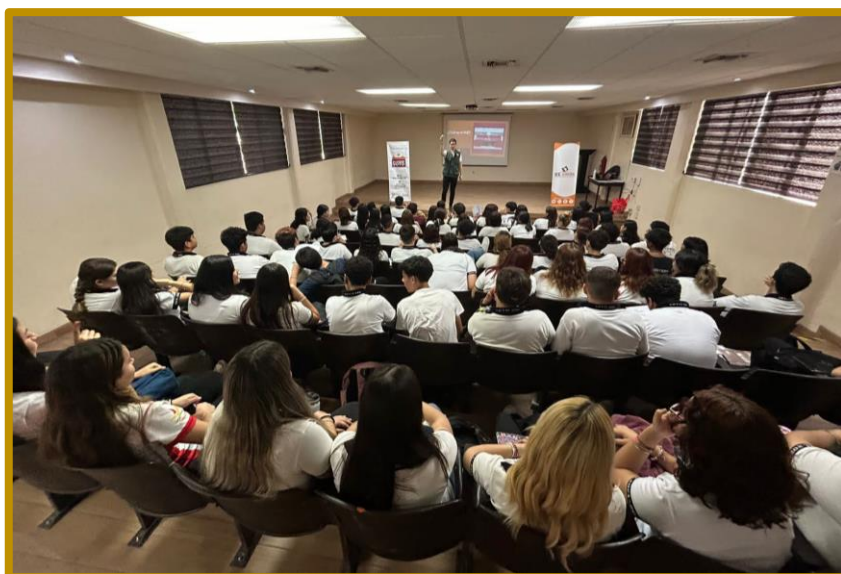
Día 25 de septiembre de 2023. Presentación del programa Mi Primer Voto a estudiantes del CBTIS No. 206.

El lunes 25 de septiembre de 2023, se presentó el programa Mi Primer Voto ante juventudes del CBTIS No. 206 . La actividad se efectuó en al auditorio de la institución educativa.