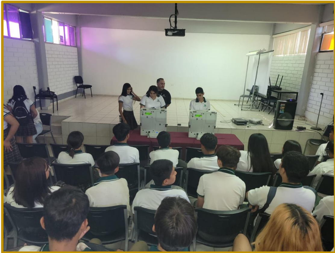
Día 26 de septiembre de 2023. Alumnado del Conalep Plantel Hermosillo III, utilizando urnas electrónicas en la elección de la sociedad de alumnos 2023-2024.