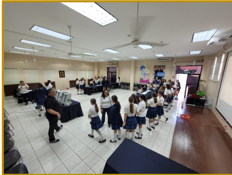
Día 21 de septiembre de 2023. Participación de alumnas del Colegio Liceo Thezia en la renovación de la sociedad de alumnas 2023-2024.