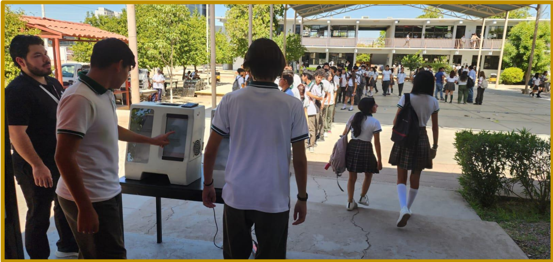
Día 26 de septiembre de 2023. Estudiantes del Conalep Plantel Hermosillo II ejerciendo su derecho a votar para la elección de la sociedad de alumnos 2023-2024.