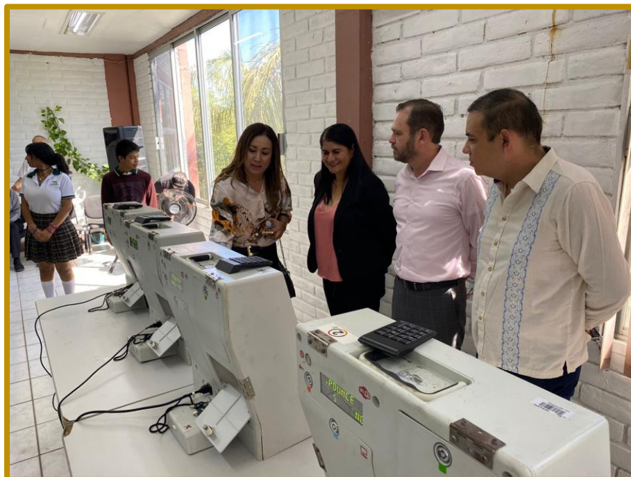
Día 25 de septiembre de 2023, Directora Ejecutiva de Educación Cívica y Capacitación, explicando el funcionamiento de las urnas electrónicas al Presidente del IEE Sonora y funcionarios/as del CONALEP Sonora.