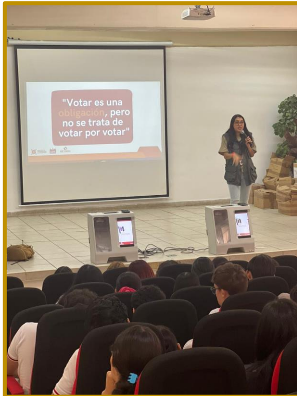
Día 12 de septiembre de 2023. Estudiantes del CECyTES, Plantel Alto Valle previa a su participación en el ejercicio democrático utilizando urnas electrónicas.

El jueves 14 de septiembre de 2023, se realizó la actividad Mi Primer Voto con el alumnado de la preparatoria del Colegio Alerce .