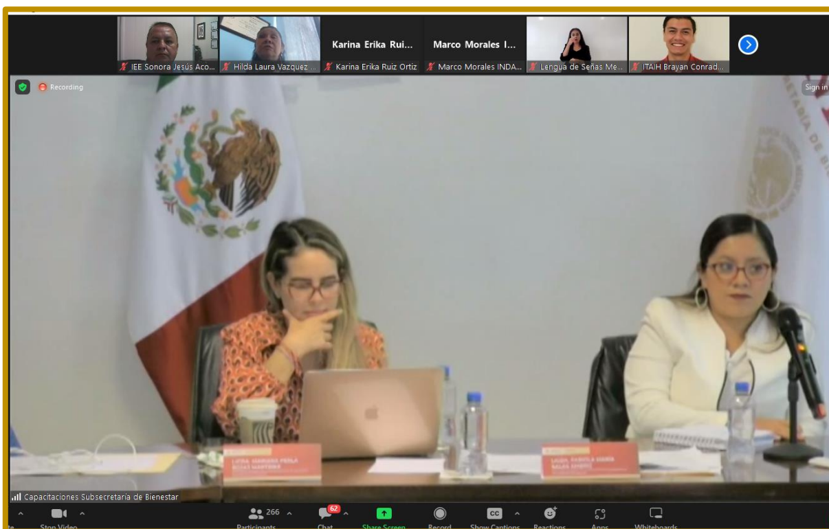
Día 02 de agosto de 2023. Personal de la Dirección Ejecutiva participando de manera virtual en el Foro Temático.

Personal de la Dirección Ejecutiva atendió la invitación enviada por la Secretaría Ejecutiva para participar en el Foro Temático: “Retos en Materia del Ejercicio de la Libertad de Expresión, de Opinión y Acceso a la Información Pública de las Personas con Discapacidad. ¿Dónde está México?” celebrado el día 02 de agosto de 2023, evento organizado por la Subsecretaría de Bienestar, en colaboración con el Instituto Morelense de Información Pública y Estadística, Instituto de Atención a las Personas con Discapacidad de la Ciudad de México, Instituto Nacional del Derecho de Autor y Comisión Nacional de los Derechos Humanos. El foro tuvo la finalidad de incentivar el diálogo constructivo entre diversos actores involucrados en la atención de las personas con discapacidad e identificar información encaminada al fortalecimiento de las políticas de atención de este sector de la población.