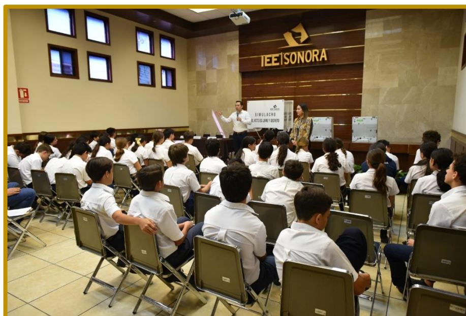
Día 18 de septiembre de 2023. Estudiantes del CDI Alfaes durante su participación en el ejercicio democrático utilizando urnas electrónicas.