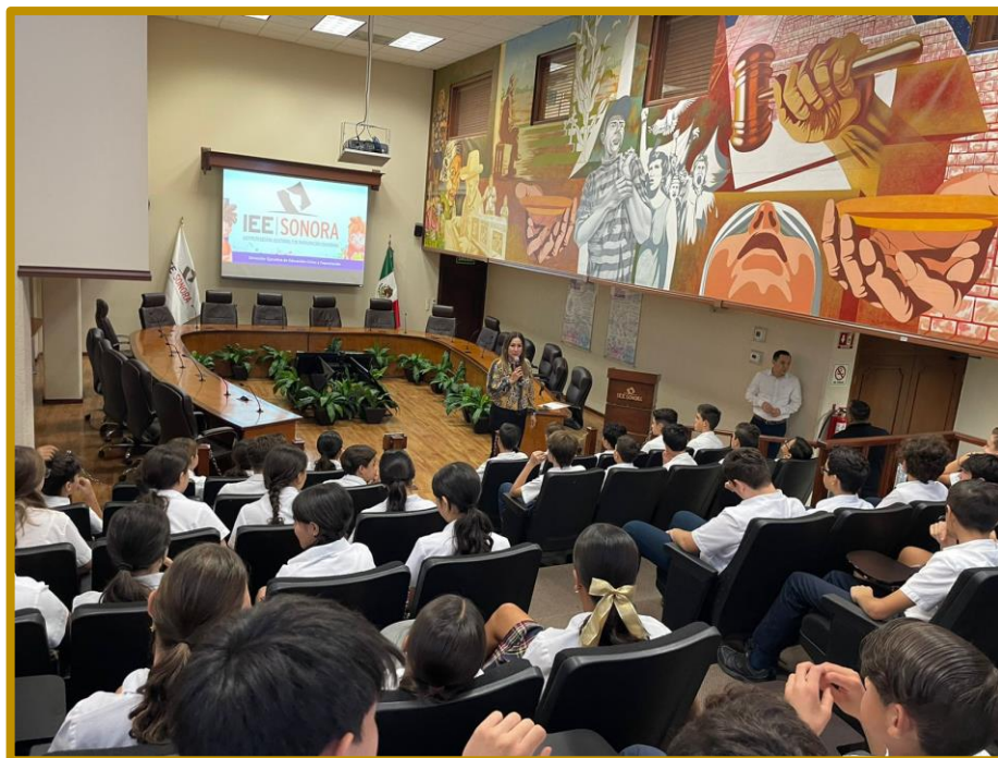
Día 18 de septiembre de 2023. Mensaje de bienvenida al alumnado de la Secundaria CDI Alfaes durante la Visita Guiada

La actividad se realizó en seguimiento al acuerdo de trámite de fecha 11 de septiembre de 2023, mediante el cual la Secretaría Ejecutiva da cuenta del escrito recibido el 08 del presente mes y año en la Oficialía de Partes de este organismo electoral, suscrito por la Directora de la Secundaria del CDI Alfaes, por el cual solicitó una Visita Guiada a las instalaciones de este Instituto para conocer las funciones del IEE Sonora.