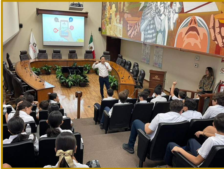
Día 18 de septiembre de 2023. Personal de la Dirección Ejecutiva durante la plática con las y los alumnos de la Secundaria CDI Alfaes