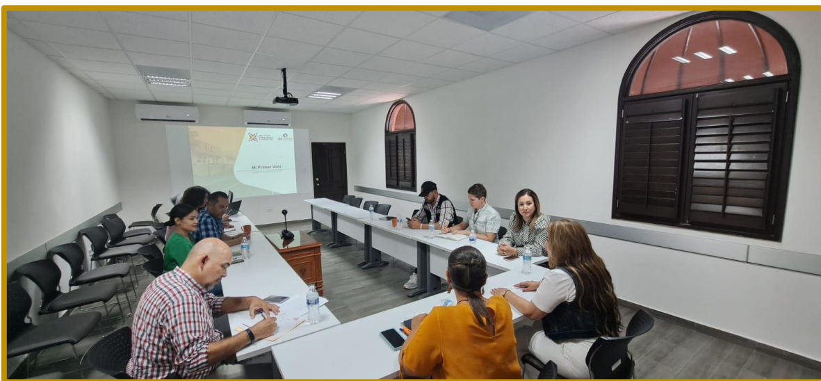
Día 10 de agosto de 2023. Personal de la Dirección Ejecutiva durante la reunión de trabajo celebrada en las instalaciones de la SEC.

En seguimiento al programa, el día 10 de agosto de 2023 se llevó a cabo reunión de trabajo en las instalaciones de la Secretaría de Educación y Cultura con las representaciones de los subsistemas CONALEP, DGETI y CECyTE Sonora, con el fin de presentar el programa y lograr una posible calendarización e implementación.