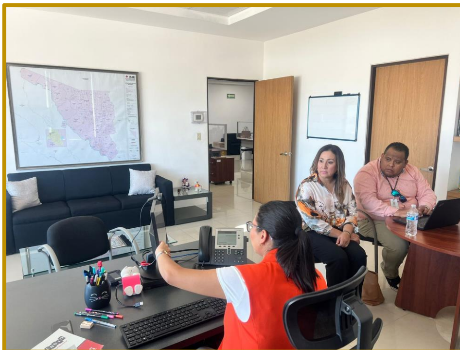
Día 25 de septiembre de 2023. Personal de la Dirección Ejecutiva acudió a las instalaciones de la JLE del INE, con el fin de atender observaciones a la Guía