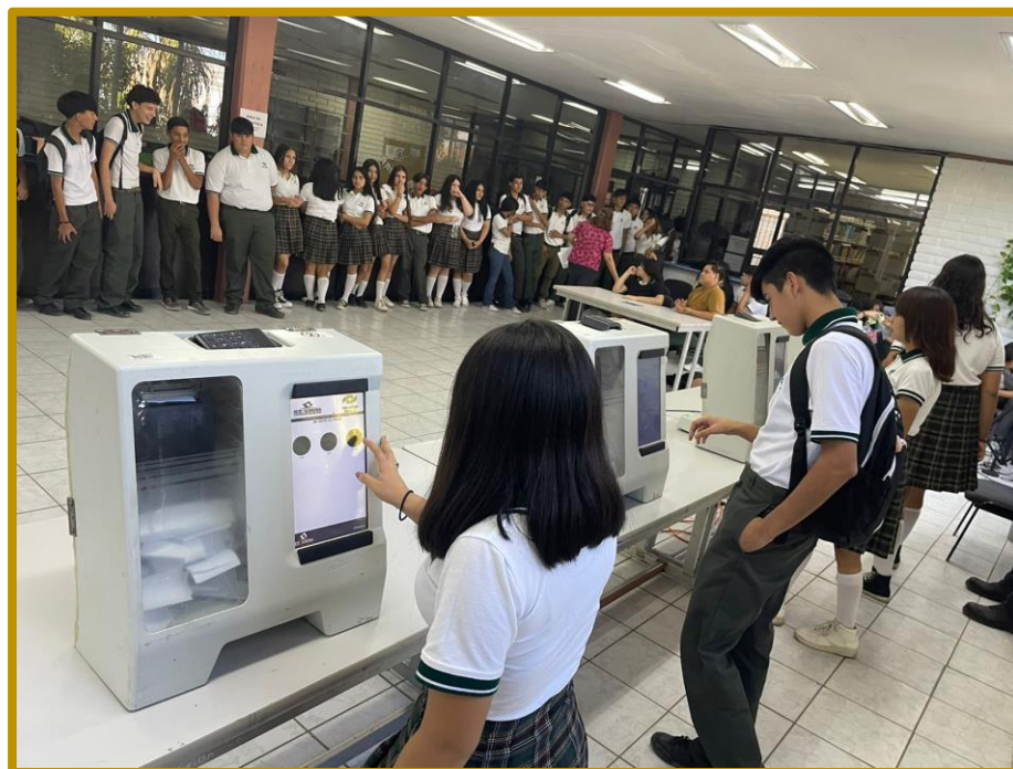
Día 25 de septiembre de 2023. Participación del alumnado del Conalep Plantel Hermosillo I, en la elección de la sociedad de alumnos.