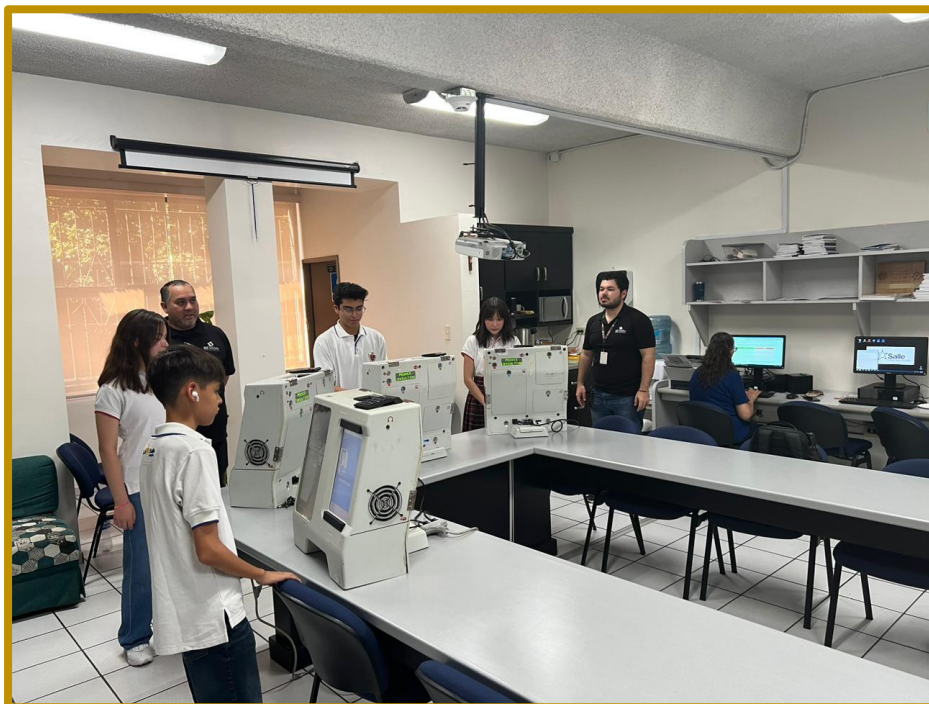
Día 25 de agosto de 2023. Estudiantes del Colegio Regis La Salle, participando en el ejercicio democrático mediante urnas electrónicas.