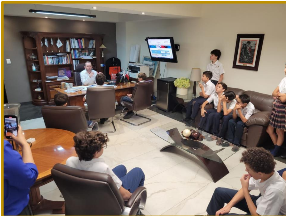
Día 18 de septiembre de 2023. Plática del Consejero Presidente con el alumnado de la Secundaria CDI Alfaes, durante la Visita Guiada.