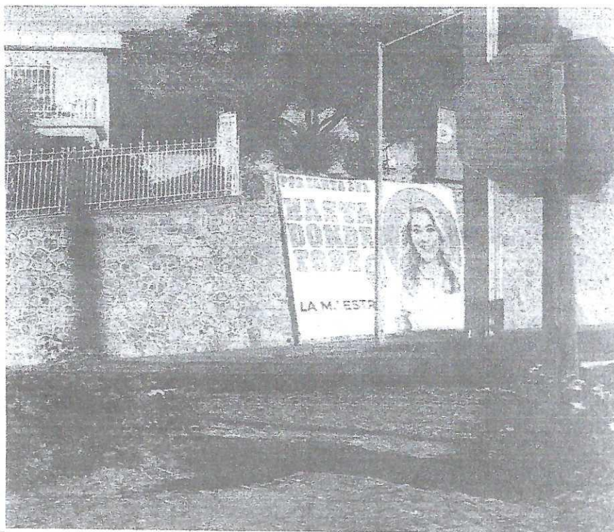
Propaganda electoral (espectacular) ubicado en la intersección (Y griega) de la carretera federal no. 15 Santa Ana - Magdalena y carretera federal no. 02 Santa Ana - Caborca, dentro de la Ciudad de Santa Ana, Sonora;